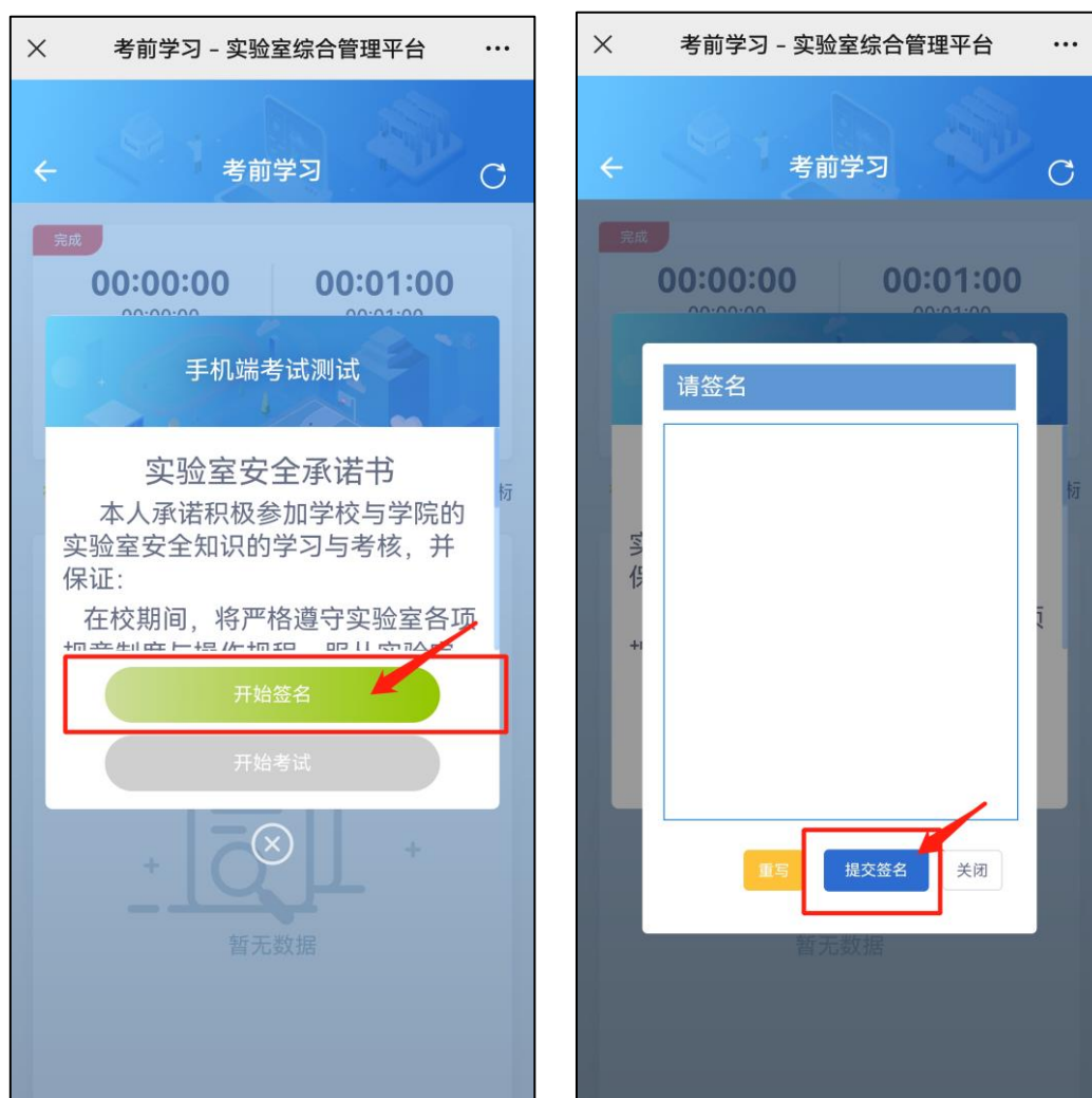
图 6 考前承诺界面

4. 签署考前承诺： 正式考试前需要签署考前承诺书，在弹窗中点击【开始签名】，签名完成并提交后，即可正式考试。